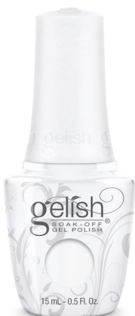
SOAK-OFF GEL POLISH

Krok 4 Na takto upravený povrch aplikujte vrchnú vrstvu GELISH No Cleanse Top Coat. Vytvrdzte 60 sekúnd v LED lampe. Manikúru ukočíte vmasírovaním výživného olejčka GELISH Nourish.