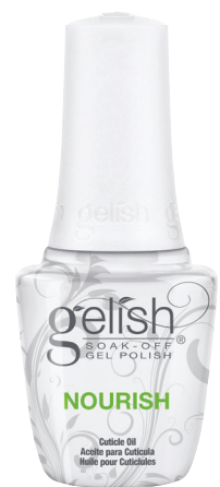
NOURISH CUTICLE OIL