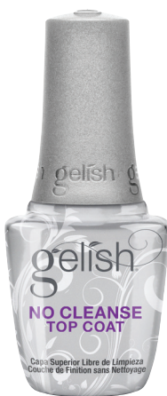
NO CLEANSE TOP COAT